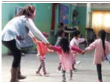
Juegos con objetos. Juegos de construcción