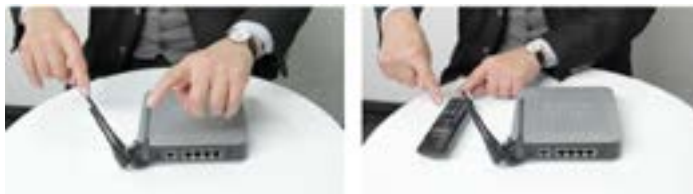
■ Primeros planos

Sí en cambio pueden (y hasta deben) usarse Primer Plano (PP), Primerísimo Primer Plano (PPP), escorzos, picados, etc, en el enfoque de procesos manuales, descriptivos, etc., a fin de no perder detalle y reforzar la sensación de involucramiento y proximidad del estudiante.