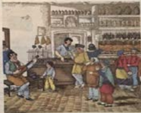
Interior de una zuplería, donde se observa a la gente de los suburbios de la ciudad. Litografía de César Bacia.

Leer las posiciones de los gobiernos de Buenos Aires y de Corrientes hacia 1930 respecto del librecambio y el proteccionismo.