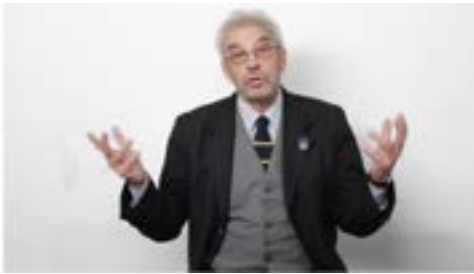
■ Ángulo Frontal

En los ejemplos anteriores con un disertante, la angulación es Frontal, Normal o Neutra. Y esto es no sólo lo más habitual, sino también lo más recomendable.