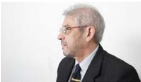
■ Enfoque lateral

Del mismo modo se desaconseja el enfoque lateral del docente, al que muchos suelen apelar (así como a las constantes oscilaciones de cámara) como una forma de supuesta originalidad, o buscando dinamismo en el curso del video.