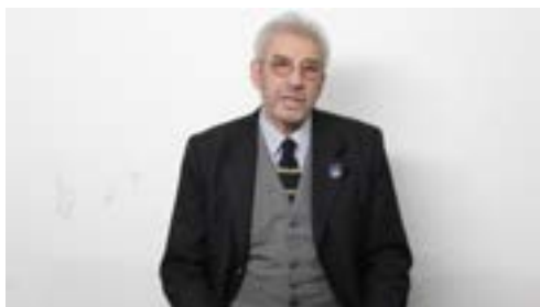
■ Plano Medio

Plano Medio: En el medio audiovisual se llama Plano Medio (P.M.) a aquel que encuadra al disertante, actor, etc., desde la cabeza hasta la cintura.