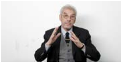
■ Plano Medio Corto

Plano Medio Corto: El Plano medio corto (P.M.C.) toma al sujeto desde la cabeza hasta la mitad del torso. La magnitud del mismo, en términos perceptivos, se incrementa respecto del caso anterior; el sujeto es aquí descontextualizado de su entorno, y obtiene una pregnancia mayor.