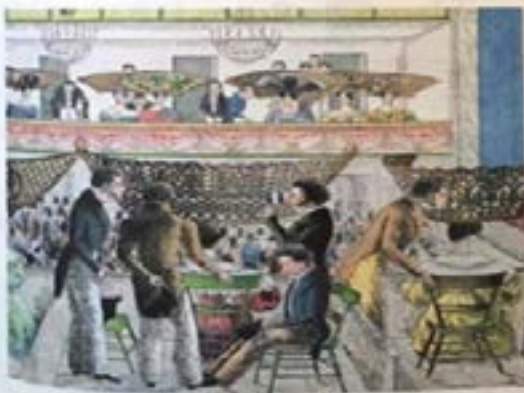
Una vesida en el teatro, donde se ve a la "gente decente", como se decía entonces. Litografía de César Bacia.

Respuesta de Ferré, representante correntino, al "Memorandum". (Adaptación)