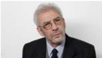
■ Primer Plano

Primer Plano: Estamos ya aquí dentro de los llamados “Planos expresivos”. El Primer Plano (PP) recoge el rostro y los hombros del disertante.